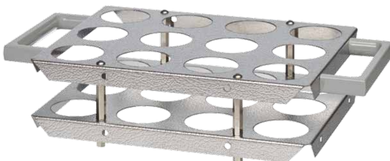
SG 12 B