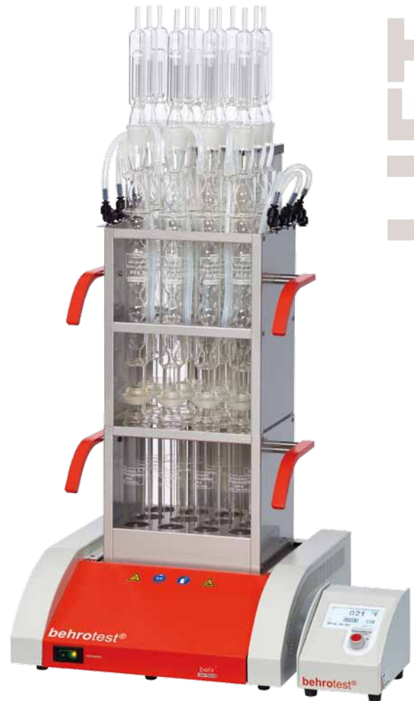
CSB/SMA 12 L