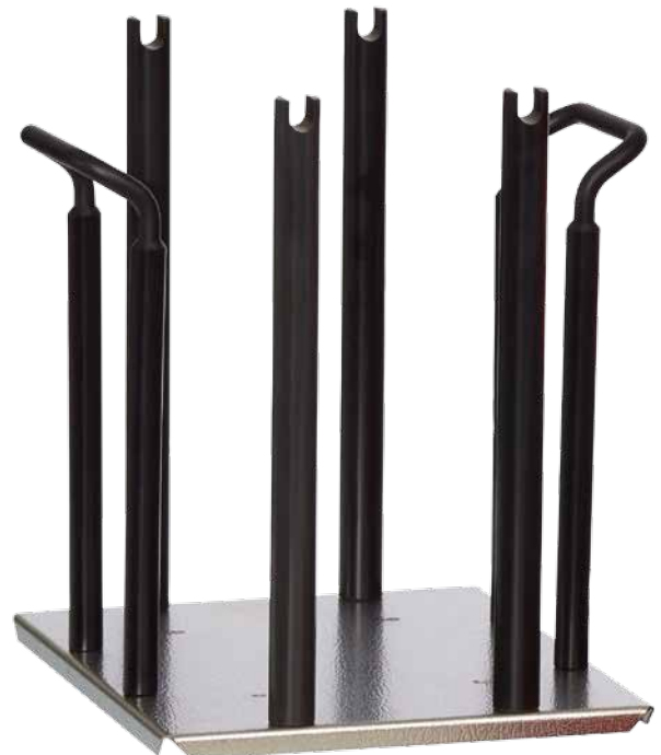
TS 12 SM