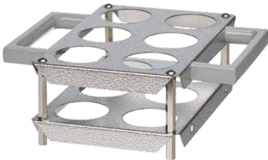
SG 6 B